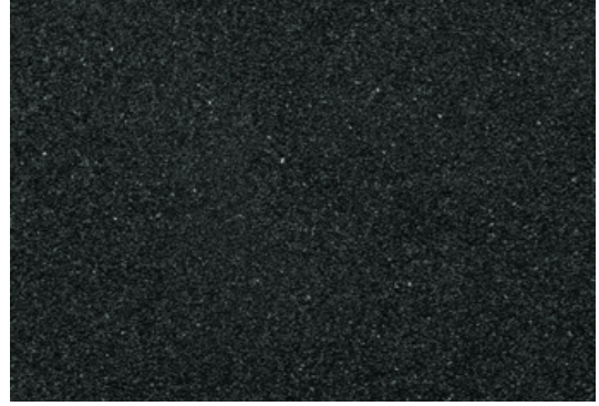
Aktif kömür – H.Antrasit

Yüzme havuzunun enerji tasarruflu işletmesi için bir başka tedbir de sistem işletme dışıyken su yüzeyinin düşürülmesidir. Bu durumda üstten taşma kanalları kurur ve sadece havuz emişinden sirkülasyon yapılır. Bu enerji tasarruflu işletme modeli Ospa BlueControl kumandasına programlanmıştır. Akıllı kumanda akışı kontrol eder. Ayrıca kanallarda su olmayacağı için klima cihazlarına da daha az nemlilik yükü düşecek, daha az enerji kullanacak ve suyun sirkülasyonu , rezerv depo hariç tutularak az bir sirkülasyonla yapılarak enerji kullanımı minimize edilmiş olacaktır.